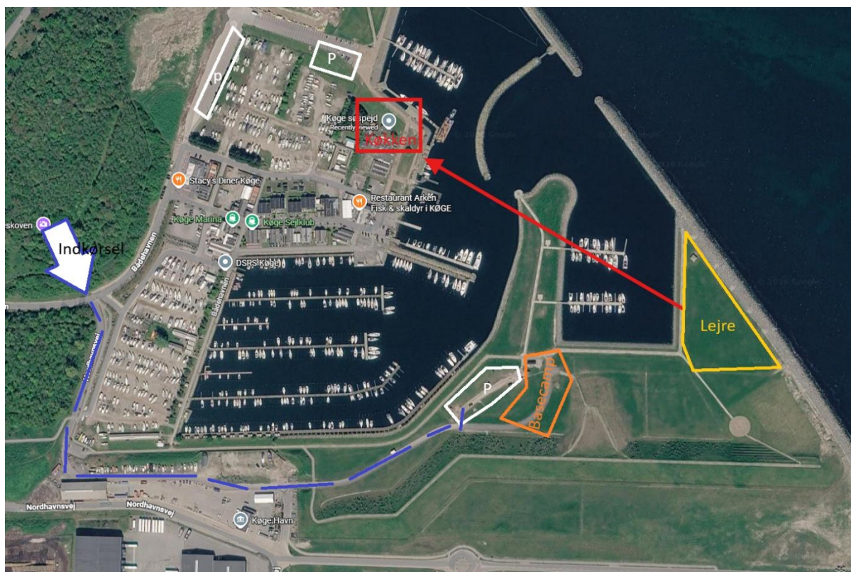
Figur 1 Kort over område